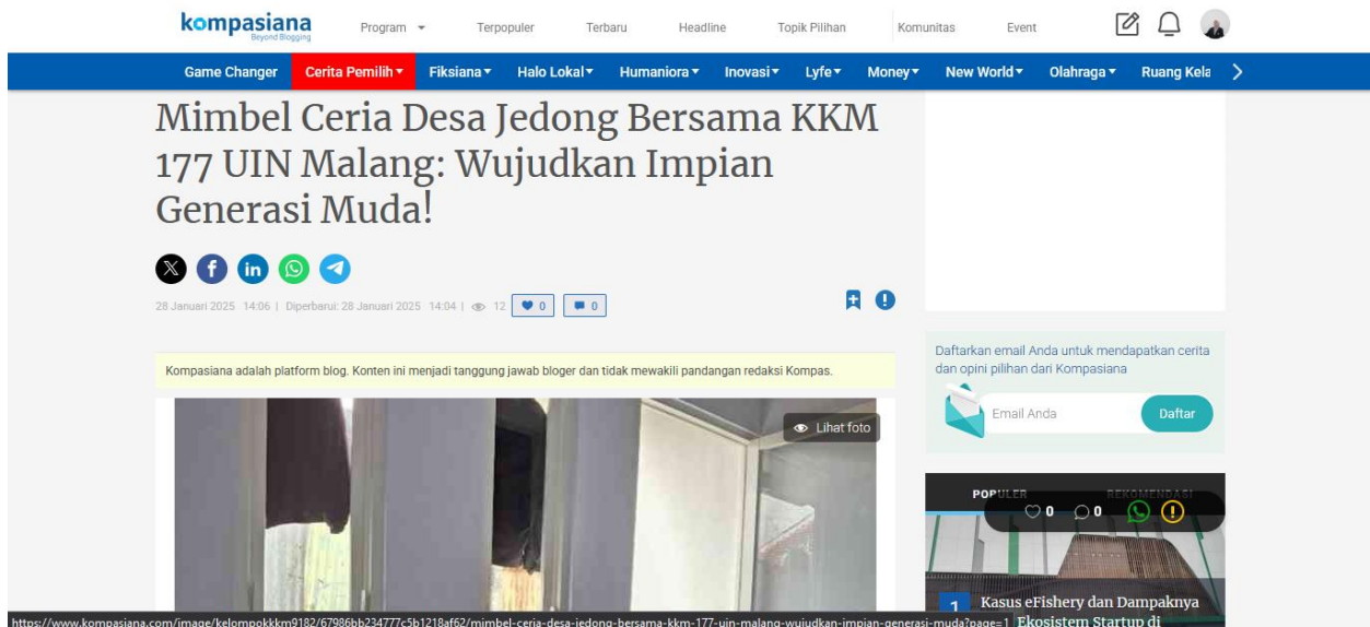
Gambar 1. Artikel Kegiatan Bimbel

https://www.kompasiana.com/kelompokkkm9182/67986bb234777c5b1218af62/mimbel-ceria-desa-jedong-bersama-kkm-177-uin-malang-wujudkan-impian-generasi-muda