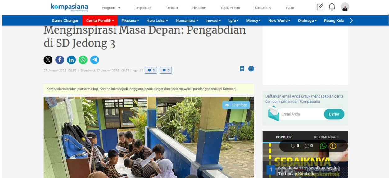
Gambar 4. Artikel Kegiatan Mengajar SDN 3 Jedong

https://www.kompasiana.com/kelompokkm9182/67967824ed64154b1d095b55/peran-orang-tua-dalam-membangun-kecerdasan-sosial-emosional-anak-di-era-digital