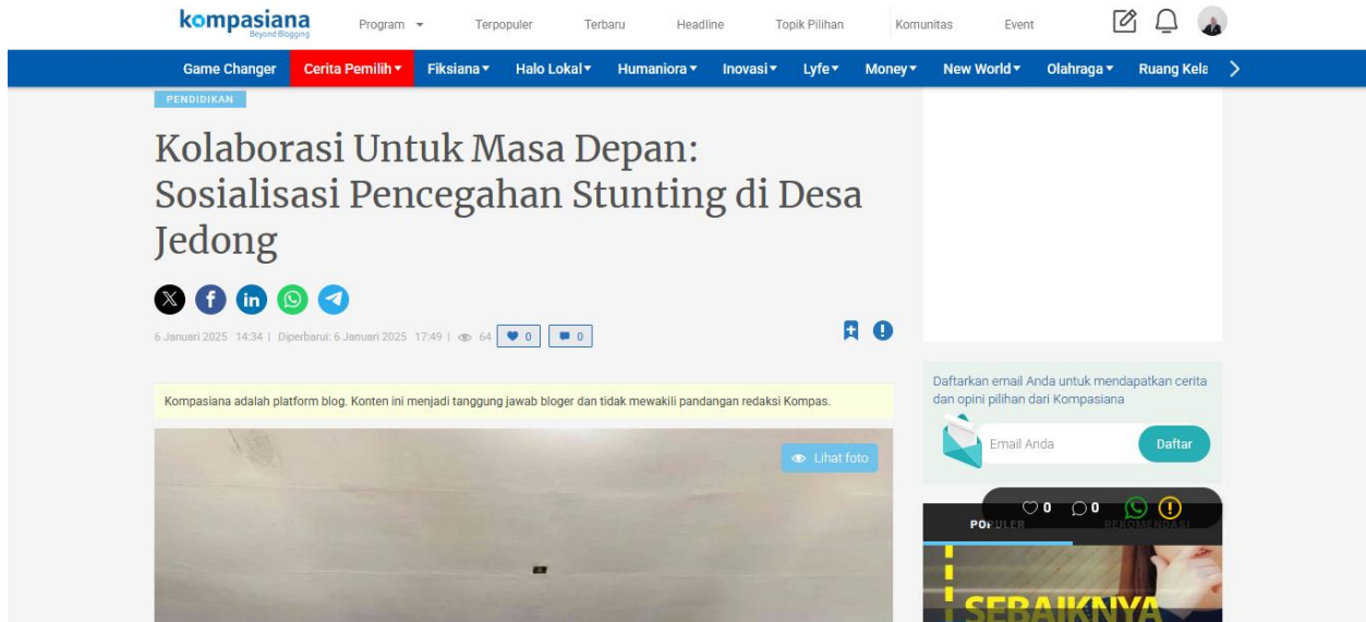
Gambar 5. Artikel Kegiatan Sosialisasi Pencegahan Stunting

https://www.kompasiana.com/kelompokkkm9182/677b8442c925c420b31d6f86/kolaborasi-untuk-masa-depan-sosialisasi-pencegahan-stunting-di-desa-jedong