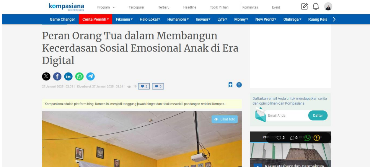
Gambar 3. Artikel Kegiatan Sosialisasi Parenting

https://www.kompasiana.com/kelompokkm9182/67967824ed64154b1d095b55/peran-orang-tua-dalam-membangun-kecerdasan-sosial-emosional-anak-di-era-digital