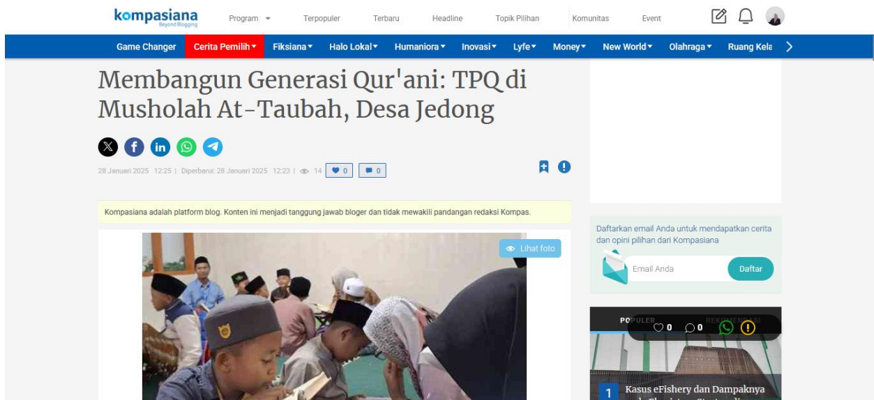
Gambar 2. Artjkel Kegiatan Mengajar TPQ At Taubah

https://www.kompasiana.com/kelompokkkm9182/67986bb234777c5b1218af62/mimbel-ceria-desa-jedong-bersama-kkm-177-uin-malang-wujudkan-impian-generasi-muda